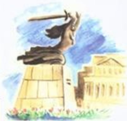
Nike - pomnik bohaterskiej stolicy.