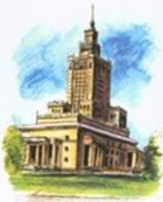
Pałac Kultury i Nauki