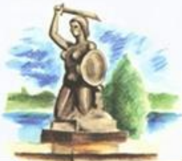
Pomnik Syreny. Syrena jest godłem Warszawy.