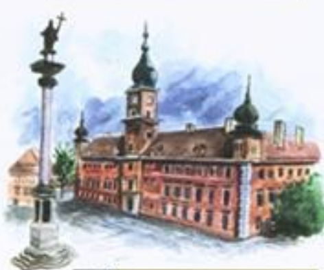
Na Placu Zamkowym stoi Kolumna Zygmunta, na prawo wznosi się Zamek Królewski.