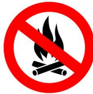
Zakaz rozpalania ognisk